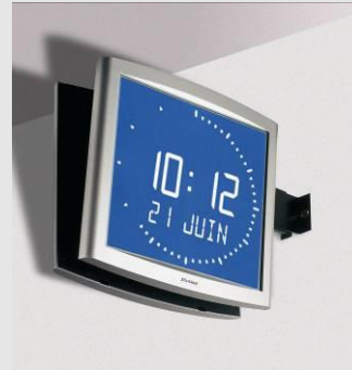
Opalys Ellipse sur support double face