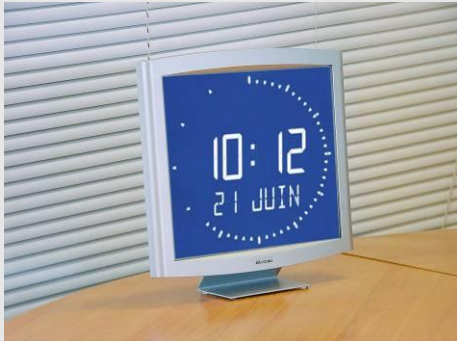
Opalys Ellipse sur support de table