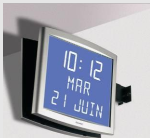
Opalys date sur support double face