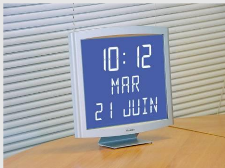
Opalys date sur support de table