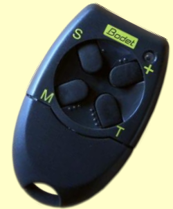
Pupitre de commande radio HF