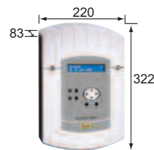
SIGMA MOD mural